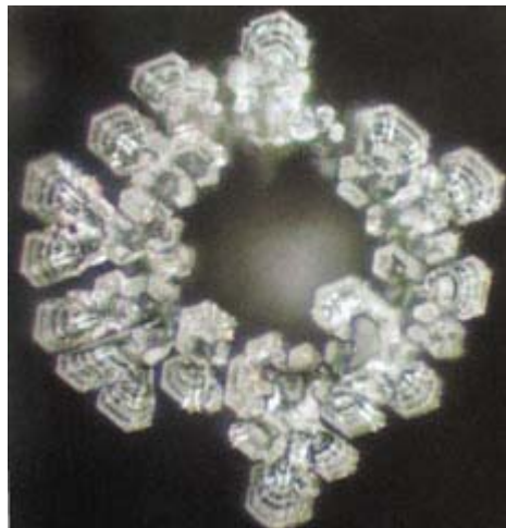
Cristal provenant de l'eau de la source de Lourdes, en France

les fois que la qualité de l'eau était bonne, des cristaux complets étaient formés, chacun étant distinct quant au motif et à la couleur. Pour les plus belles, présentant des cristaux parfaits, [on note] celles provenant d'eaux normales et non polluées dont celles des sources de Sanbuchi (dans la préfecture) de Nagasaka, et l'eau de source de Saijo, une ville située dans des montagnes situées de 500 à 700 mètres au-dessus de la mer, et qui est célèbre à cet égard.